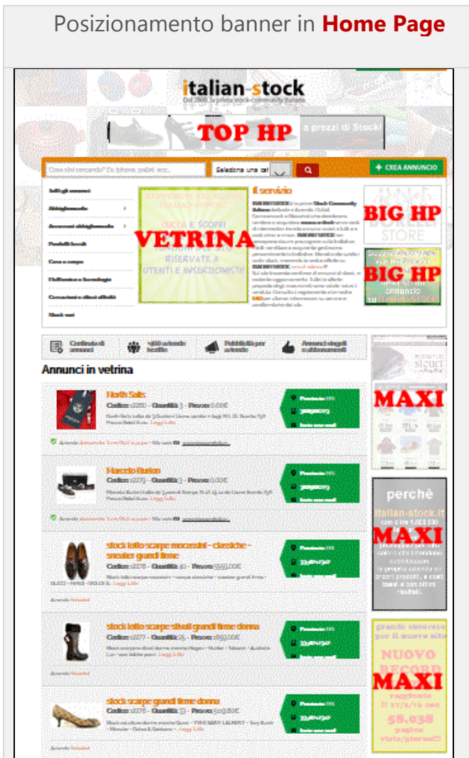
Posizionamento banner in Home Page